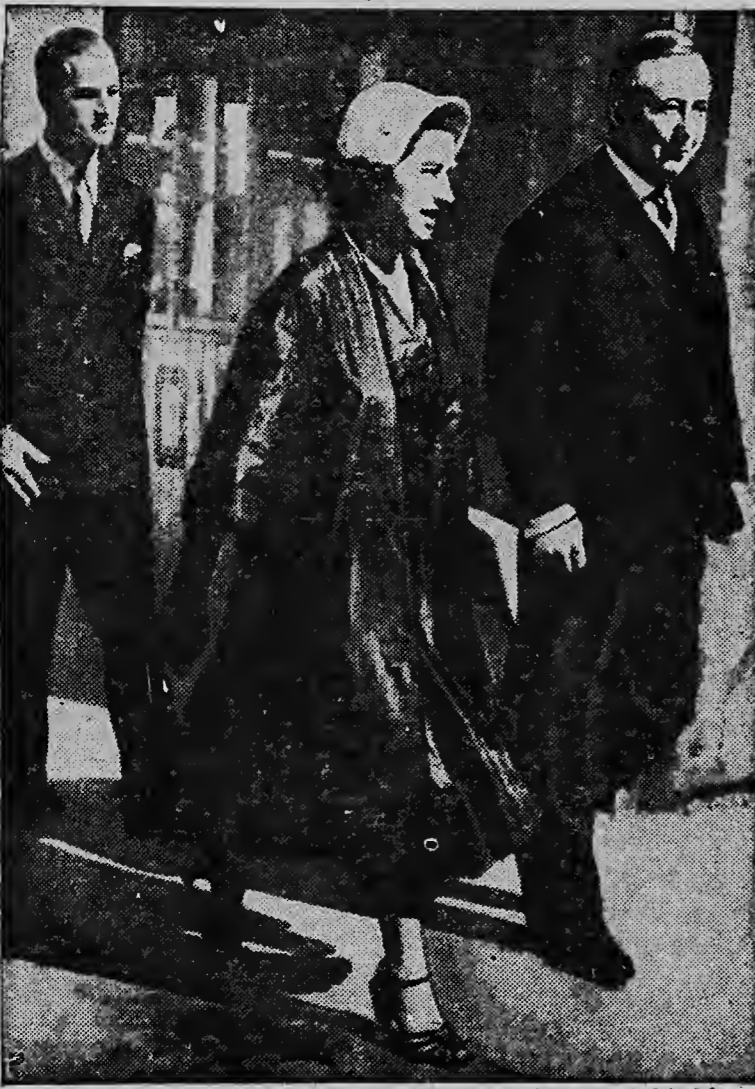
DAT HET INGEWIKKELD kroningsceremonieel zonder belangrijke fouten verliep, wat te danken aan het feit dat al maandenlang werd geoefend. Voor de Koningin werd de „rol” door een invalster gespeeld, maar H.M. kwam bijna ook dagelijks zich van de stand van zaken op de hoogte stellen, zoals uit bovenstaande foto blijkt, waarbij de hertog van Norfolk, die verantwoordelijk was voor het gehele eere-moniël, de Koningin en de Hertog van Edinburgh de Abdij binnenleidt. „Stand in” voor de Koningin was de Hertogin van Norfolk.

Het Witte Huis heeft bekend gemaakt dat President Eisenhower en vier van zijn ministers op 4 Juni voor de Amerikaanse radio en de Amerikaanse televisie-stations internationale en binnenlandse vraagstukken zullen bespreken.